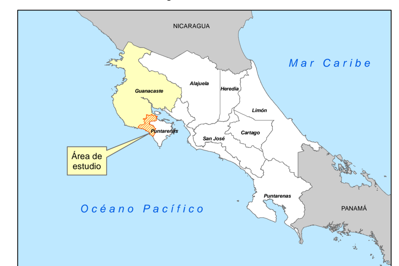
MATRIZ DE VALORES DE TERRENOS AGROPECUARIOS PROVINCIA 5 GUANACASTE CANTÓN 09 NANDAYURE.