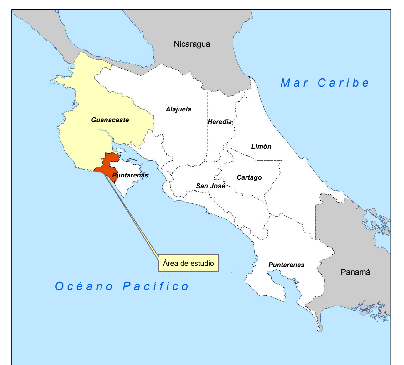
Diagrama de Ubicación